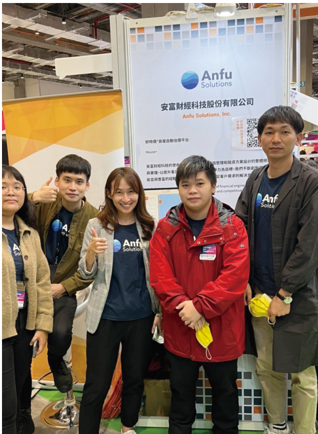
▼安富團隊參與展覽（中間為筱蓉老師）