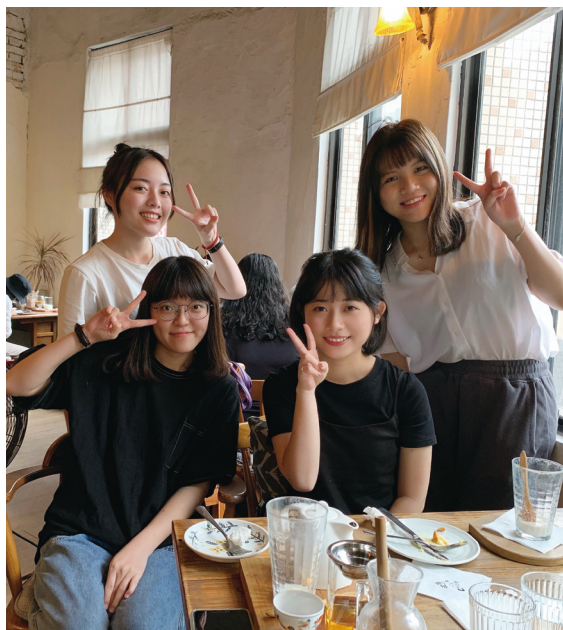
▲三分鐘與 Career 志工團團員合照