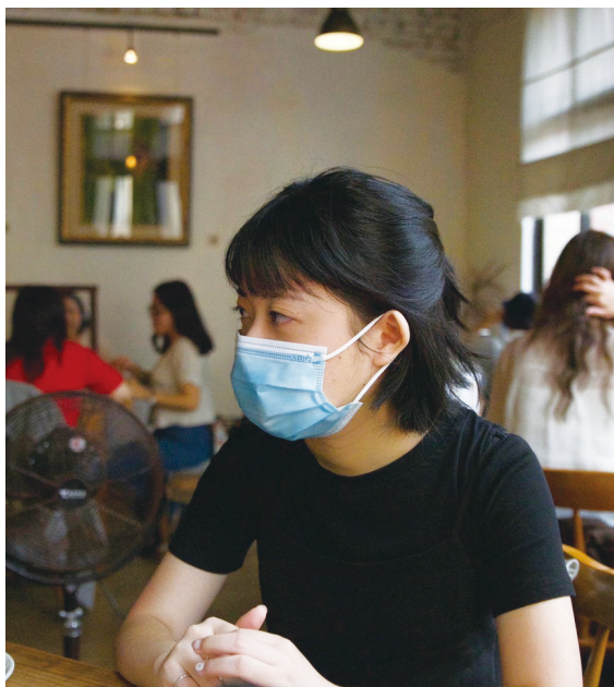
▲三分鐘喜歡充實自己，不想讓時間被浪費

三分鐘認為要確定自己適不適合某個產業，要真的試過才會知道，因為對三分鐘而言，考證照等都是其次，最重要的還是要嘗試過。如果沒有去試，可能真的沒有辦法確定自己對於此領域是不是確實適合。如果可以的話，大學階段可以嘗試很多活動，就算你知道那個領域可能不是自己未來的職涯方向，但是大學階段就是一個多方嘗試的時期，所以不要浪費，盡量都試看看。