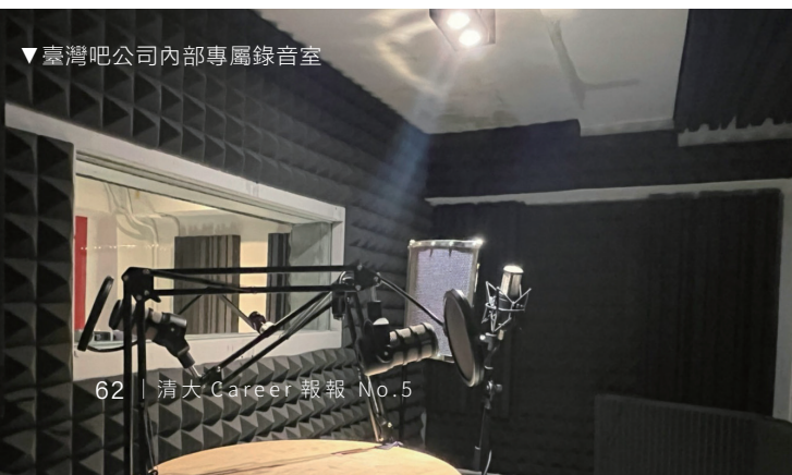
▼臺灣吧公司內部專屬錄音室